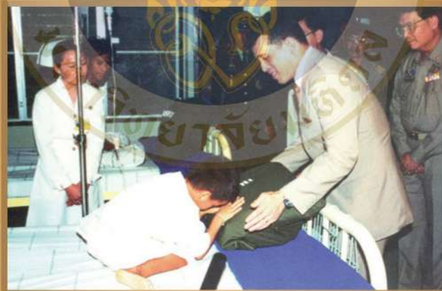
เสด็จพระราชดำเนินทรงตรวจเยี่ยมโรงพยาบาลสมเด็จพระยุพราชสว่างแดนดิน จังหวัดสกลนคร เมื่อวันที่ ๒๒ สิงหาคม พ.ศ. ๒๕๓๘