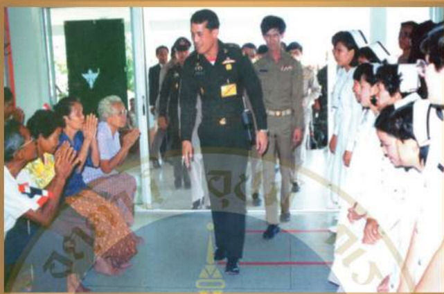
เสด็จพระราชดำเนินทรงตรวจเยี่ยมโรงพยาบาลสมเด็จพระยุพราชธาตุพนม จังหวัดนครพนม เมื่อวันที่ ๒๕ กรกฎาคม พ.ศ. ๒๕๓๐