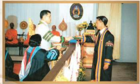
พระราชทานปริญญาบัตรแก่ผู้สำเร็จการศึกษาจากสถาบันราชภัฏสวนดุสิต ณ อาคารใหม่ สวนอัมพร

พิธีพระราชทานปริญญาบัตรแก่บัณฑิต มหาวิทยาลัยสุโขทัยธรรมมาธิราช วันพุธที่ ๑๗ มกราคม ๒๕๓๘ ภาคเช้า ณ อาคารใหม่ สวนอัมพร