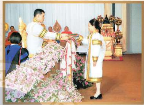
พระราชทานปริญญาบัตรแก่ผู้สำเร็จการศึกษาจากมหาวิทยาลัยสุโขทัยธรรมศาสตร์ ณ อาคารใหม่ สวนอัมพร

นอกจากทุนการศึกษาที่พระราชทานให้กับโรงเรียนต่างๆ แล้ว พระราชกฤษฎีกาขึ้นการศึกษาที่สำคัญอีกประการหนึ่งในสมเด็จพระเจ้าอยู่หัวคือ การพระราชทานปริญญาบัตรแก่ผู้สำเร็จการศึกษาจากสถาบันในระดับอุดมศึกษาต่างๆ เป็นจำนวนมากในทุกๆ ปี ทั้งยังทรงพระกรุณาพระราชทานพระบรมราโชวาทเพื่อให้ข้อคิดแก่บัณฑิตผู้เข้ารับพระราชทานปริญญาบัตรในรอนั้นๆ เป็นที่ปราบปลื้มใจแก่ผู้ที่ได้เข้ารับฟัง และต่างน้อมนำพระบรมราโชวาทที่ทรงพระกรุณาพระราชทานไว้ นั้น ไปปรับใช้กับชีวิตประจำวันได้เป็นอย่างดี ดังพระบรมราโชวาทที่อัญเชิญมาเป็นตัวอย่างดังต่อไปนี้