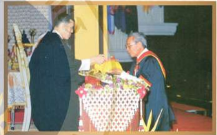
มหาวิทยาลัยธรรมศาสตร์ ท่าพระจันทร์ ถวายปริญญาศิลปศาสตรบัณฑิตบัณฑิตกิตติมศักดิ์ ปีการศึกษา ๒๕๔๓