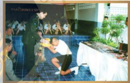
เสด็จพระราชดำเนินทรงเปิดโรงเรียนมัธยมสิริวัณณวรี ๓ ฉะเชิงเทรา เมื่อวันที่ ๒๗ สิงหาคม พ.ศ. ๒๕๓๕

เงินที่มีผู้ทูลเกล้าฯ ถวายในวันนั้นๆ ให้กับโรงเรียนแต่ละแห่งด้วย ทั้งยังเสด็จเยี่ยมและพระราชทานพระราชทรัพย์ส่วนพระองค์เพิ่มเติมให้กับโรงเรียนในพระราชูปถัมภ์อย่างต่อเนื่องอีกด้วย