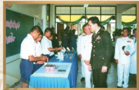
เสด็จพระราชดำเนินทรงเปิดโรงเรียนมัธยมพัชรกิติยาภา ๒ กำแพงเพชร เมื่อวันที่ ๒๐ สิงหาคม พ.ศ. ๒๕๓๕

สมเด็จพระเจ้าอยู่หัวมหาวชิราลงกรณ บดินทรเทพยวรางกูร เมื่อครั้งยังดำรงพระอิสริยยศเป็น สมเด็จพระบรมโอรสาธิราช เจ้าฟ้ามหาวชิราลงกรณ สยามมกุฎราชกุมาร ทรงเล็งเห็นถึงความสำคัญของการศึกษาระดับมัธยมศึกษา และการพัฒนาการศึกษาของเยาวชน มีพระราชประสงค์ที่จะกระจายการจัดการศึกษาไปสู่ท้องถิ่นรกรากห่างไกล ด้วยทรงมีพระทัยว่า การศึกษาระดับนี้ จะมีส่วนส่งเสริมให้เยาวชนของชาติ มีพื้นฐานความรู้เหมาะสมที่จะดำรงชีวิตอยู่อย่างมีคุณภาพ จึงได้พระราชทานพระราชทรัพย์ส่วนพระองค์จำนวน ๗ ล้านบาท เมื่อวันที่ ๒๒ มิถุนายน ๒๕๒๒ เพื่อเป็นทุนก่อสร้างโรงเรียนกวมสามัญศึกษา และสำนักงบประมาณได้จัดงบประมาณสมทบในการก่อสร้างโรงเรียนทั้ง ๒ โรงเรียน ด้วยพระมหากรุณาธิคุณอย่างหาที่สุดมิได้ ยังได้พระราชทานพระนามาภิไธยย่อ ม.ว.ก. รัถยเชิญขึ้นประดับ ณ อาคารเรียนทั้ง ๒ โรงเรียน ตามที่ได้พระราชทานชื่อไว้คือ โรงเรียนมัธยมพัชรกิติยาภา ๑ นครพนม โรงเรียนมัธยมพัชรกิติยาภา ๒ กำแพงเพชร โรงเรียนมัธยมพัชรกิติยาภา ๓ สุราษฎร์ธานี โรงเรียนมัธยมสิริวัณณวรี ๑ อุดรธานี โรงเรียนมัธยมสิริวัณณวรี ๒ สงขลา และโรงเรียนมัธยมสิริวัณณวรี ๓ ฉะเชิงเทรา และได้เสด็จพระราชดำเนินไปทรงประกอบพิธีวางศิลาฤกษ์ พร้อมทั้งพระราชทาน