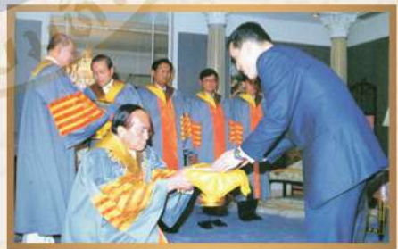
มหาวิทยาลัยเทคโนโลยีสุรนารี ท่าพระจันทร์ ถวายปริญญาวิศวกรรมศาสตรบัณฑิตกิตติมศักดิ์ ปีการศึกษา ๒๕๓๘