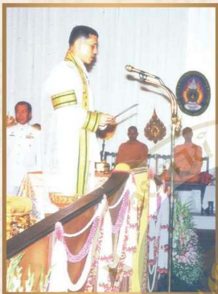
พระราชทานพระบรมราโชวาทในพิธีพระราชทานปริญญาบัตรแก่ ผู้สำเร็จการศึกษาจากสถาบันราชภัฏทั่วประเทศ