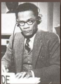
ศาสตราจารย์ นายแพทย์สวัสดิ์ แดงสว่าง 3 กันยายน พ.ศ. 2502 - 2 มิถุนายน พ.ศ. 2507