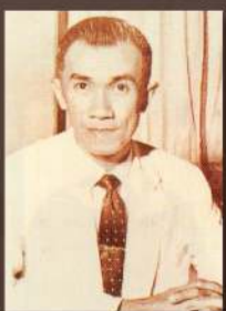
ศาสตราจารย์ นายแพทย์ชัชวาล โอสถานนท์ 3 มิถุนายน พ.ศ. 2507 - 8 ธันวาคม พ.ศ. 2512