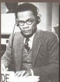
ศาสตราจารย์ นายแพทย์สวัสดิ์ แดงสว่าง 16 สิงหาคม พ.ศ. 2501 - 2 กันยายน พ.ศ. 2502

อธิการบดีมหาวิทยาลัยแพทยศาสตร์ สำนักนายกรัฐมนตรี