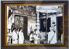
ชุดข้าราชการพระมหาเศวตฉัตร ณ พระที่นั่งสุทไธสวรรยปราสาท

พระมหาเศวตฉัตร หรือเศวตฉัตรพระมหาเศวตฉัตร เป็นฉัตรทำด้วยทองคำทองสัมฤทธิ์ ๘ ชั้น แต่จะมีประติมากรรมของโลหะอื่นใน ๖ ชั้น ใช้ปักหรือสวม ประดิษฐานเหนือพระรัตนตรัยหรือในพระที่นั่งสำคัญต่างๆ เช่นวัดพระเชตุพนวิมลมังคลารามราชวรมหาวิหาร วัดสุทัศน์สุทธาราม เป็นเศวตฉัตรของพระราชาธิบดียศสำหรับพระมหาจักรีบรมราชูปถัมภ์ที่ประทับพระราชพิธีบรมราชาภิเษกตามโบราณราชพิธีมีไว้ประดับเศวตฉัตร (ฉัตร 7 ชั้น) เสด็จไปทรงพระมหาเศวตฉัตร (ฉัตร ๖ ชั้น) ฉัตรขาว ๖ ชั้น เป็นต้น สำหรับประดับพระอิศริยยศขณะปฏิบัติราชการต่างๆ ของพระบรมมหาราชวัง