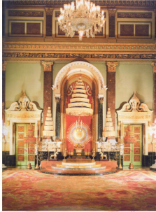
พระมหาเศวตฉัตร ณ วัดมหาธาตุยุวราชรังสฤษฎิ์ราชวรมหาวิหาร กรุงเทพมหานคร