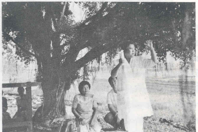
พิธีเสี่ยงทายด้วยเทียน ๑๒ เล่ม