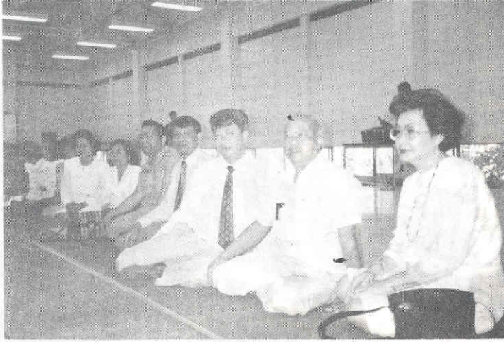
ผู้บริหารในมหาวิทยาลัยมหิดลสาขาศาสนาที่มาร่วมงาน