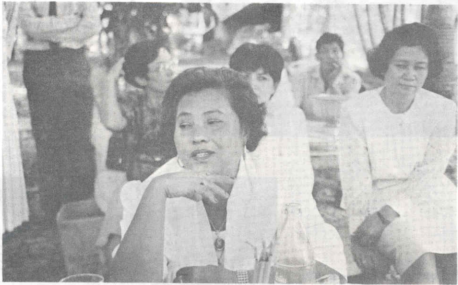
คนเข้าทรง