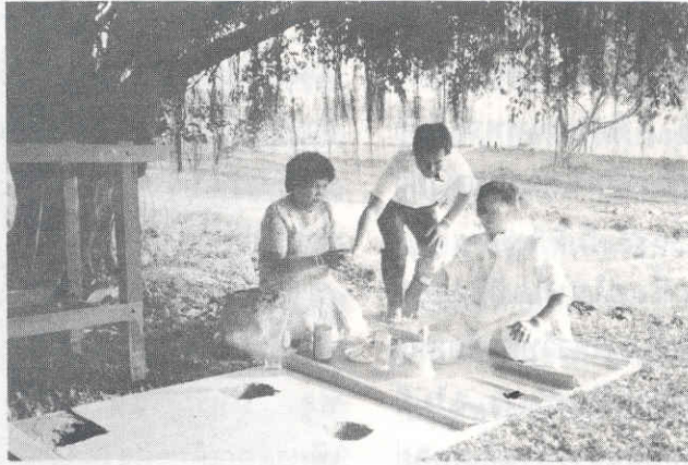
ชุดหลุมทั้ง ๔