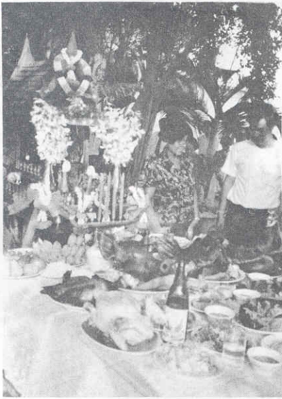
เครื่องสังเวย