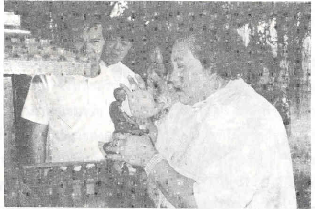
ปิดทองที่รูปปั้นเจ้าขุนท่ง