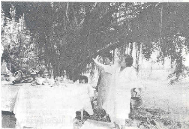
รำถวายมือ