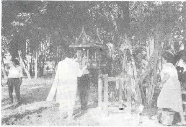
ยกศาลขึ้นตั้ง