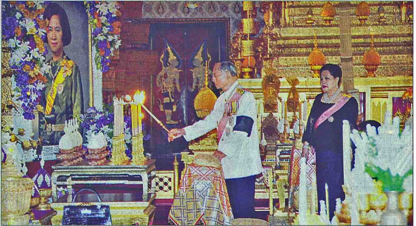
พระบาทสมเด็จพระเจ้าอยู่หัว และสมเด็จพระนางเจ้าฯ พระบรมราชินีนาถ เสด็จฯ ไปในการพระราชพิธีธรรมเสด็จพระและเชิดชูพระอัฐิ