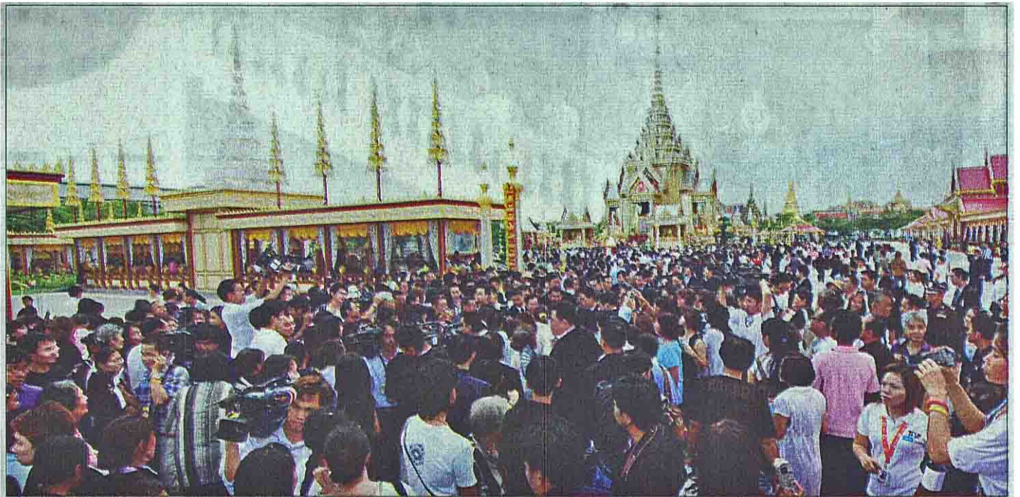
☒ ชมความงาม...คลื่อนมหาชนหลังไหลชมความงดงามวิจิตรของพระเมรุและร่วมรำลึกพระกรุณาธิคุณ สมเด็จพระเจ้าพี่นางเธอฯ หลังเปิดนิทรรศการเทิดพระเกียรติ เพื่อเผยแพร่ความเป็นมาของโบราณราชประเพณี พระกรณียกิจ พระอัจฉริยภาพ พระจริยวัตร ตั้งแต่วันที่ 18-30 พ.ย. บริเวณมณฑลพิธีท้องสนามหลวง

ต่อมาพระบาทสมเด็จพระเจ้าอยู่หัว ทรงพระกรุณาโปรดเกล้าฯ ให้สมเด็จพระบรมโอรสาธิราชฯ สยามมกุฎราชกุมาร ทรงจุดธูปเทียนคูหนังสือเทศน์พระราชทานให้เจ้าพนักงานพระราชพิธีเชิญไปตั้งที่ธรรมาสน์ พระธรรมกิตติวงศ์ วัดราชโอรสาราม ถวายพระธรรมเทศนาบท สาธุกัมมถา ใจความสำคัญตอนหนึ่งกล่าวถึง สมเด็จพระเจ้าพี่นางเธอ เจ้าฟ้ากัลยาณิวัฒนาฯ นั้นเป็นที่ประจักษ์กันแล้วว่าทรงอุทิศพระองค์เพื่อปวงชน