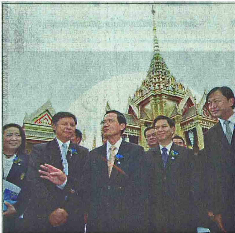
เปิดนิทรรศการ...นายสมชาย วงศ์สวัสดิ์ นายกรัฐมนตรี และ รมว.กลาโหม เป็นประธานเปิดนิทรรศการสมเด็จพระเจ้าพี่นางเธอ เจ้าฟ้ากัลยาณิวัฒนาฯ ให้ประชาชนเข้าชม เพื่อน้อมรำลึกถึงพระกรุณาธิคุณ

ในเวลา 13.58 น. พระที่นั่งราชนทรยานเทียบที่อู่ฉันทร์ตะวันออกพระที่นั่งจักรีมหาปราสาทแล้ว เจ้าพนักงานภูษามาลาเชิญพระโกศพระอัฐิพักไว้หน้าพระวิมาน สมเด็จพระบรมโอรสาธิราชฯ สยามมกุฎราชกุมาร และสมเด็จพระเทพรัตนราชสุดาฯ สยามบรมราชกุมารี ทรงจุดธูป