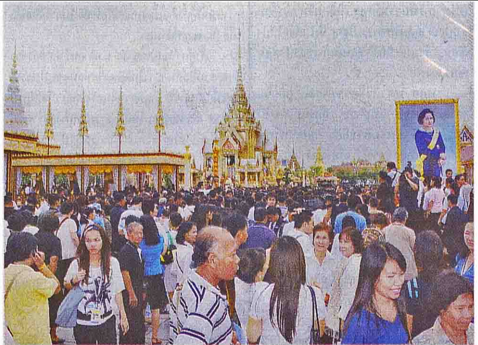
แห่ชมพระเมรุ ประชาชนจำนวนมากหลังไหลเข้าชม ความงดงามของพระเมรุและอาคารประกอบ ภายหลังจาก เสร็จสิ้นพระราชพิธีพระราชทานเพลิงพระศพ สมเด็จพระเจ้า พี่นางเธอฯ ณ มณฑลพิธีท้องสนามหลวง ซึ่งมีการจัด นิทรรศการเทิดพระเกียรติ สมเด็จพระเจ้าพี่นางเธอฯ

พระบาทสมเด็จพระเจ้า อยู่หัว และสมเด็จพระนาง เจ้าฯ พระบรมราชินีนาถ พร้อมพระบรมวงศานุวงศ์ เสด็จทรงประกอบพระราช พิธีเชิญพระโกศพระอัฐิขึ้น ประดิษฐาน ★ มีต่อหน้า 11