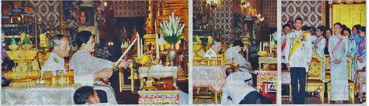
พระบาทสมเด็จพระเจ้าอยู่หัว และสมเด็จพระนางเจ้าฯ พระบรมราชินีนาถ เสด็จฯ พร้อมพระบรมวงศานุวงศ์ ไปทรงบำเพ็ญพระราชกุศลพระอัฐิสมเด็จพระเจ้าพี่นางเธอ เจ้าฟ้ากัลยาณิวัฒนาฯ ณ พระที่นั่งดุสิตมหาปราสาท