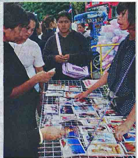
ประชาชนซื้อพระฉายาลักษณ์เป็นที่ระลึก