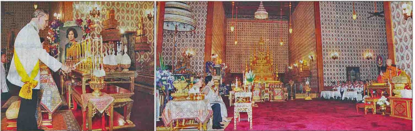
พระบาทสมเด็จพระเจ้าอยู่หัว และสมเด็จพระนางเจ้าฯ พระบรมราชินีนาถ เสด็จฯ ไปทรงบำเพ็ญพระราชกุศลพระอัฐิสมเด็จพระเจ้าพี่นางเธอ เจ้าฟ้ากัลยาณิวัฒนา กรมหลวงนราธิวาสราชนครินทร์ ณ พระที่นั่งดุสิตมหาปราสาท ในพระบรมมหาราชวัง