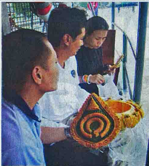
เชิญยอดพระจิตกาธานไปจำเริญ (ลอยน้ำ)