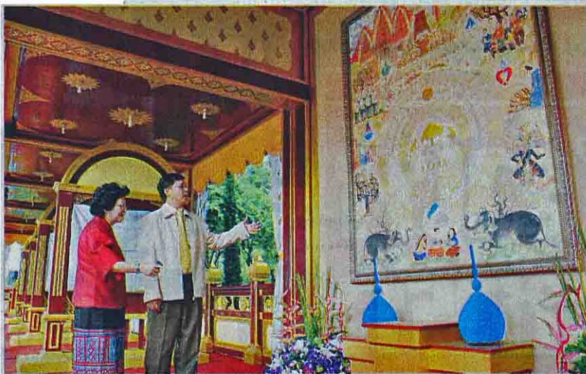
ตรวจภาพจิตรกรรมฝาผนังในมณฑลพิธีเพื่อเตรียมเปิดให้ประชาชนเข้าชม