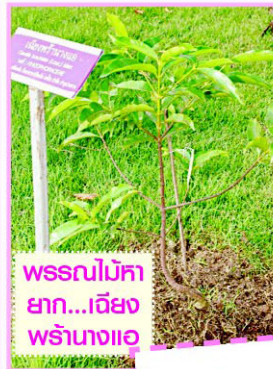
พรรณไม้หายาก...เฉียงพร้านางแอ