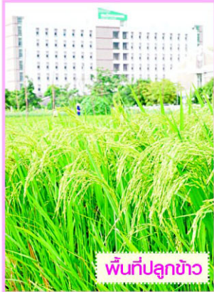
พื้นที่ปลูกข้าว