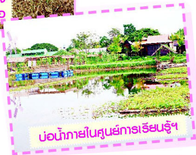
บ่อน้ำภายในศูนย์การเรียนรู้

น รมว.วิชาการเกษตรจัดสร้าง สวนพรรณไม้หายากและศูนย์เรียนรู้การผลิตพืชตามแนวพระราชดำริทฤษฎีใหม่ขึ้นเพื่อเฉลิมพระเกียรติสมเด็จพระเทพรัตนราชสุดาฯ สยามบรมราชกุมารี ในโอกาสที่ทรงเจริญพระชนมพรรษา 55 พรรษาในปี 2553 ซึ่งต่อมาได้รับพระราชทานชื่อว่า "สวนเฉลิมพระเกียรติฯ 55 พรรษา" โดยมีพื้นที่ 17 ไร่ ประกอบด้วยพื้นที่ 2 ส่วน คือ