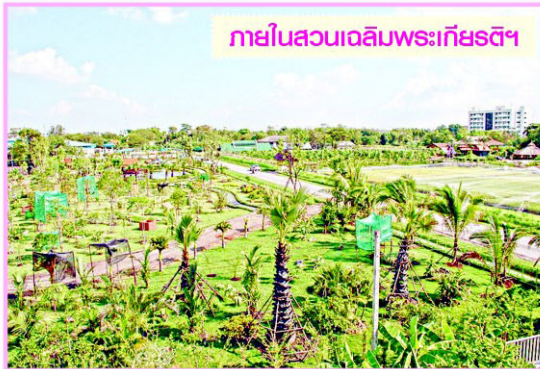
ภายในสวนเฉลิมพระเกียรติฯ