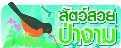
สัตว์สวยงาม ป่างาม