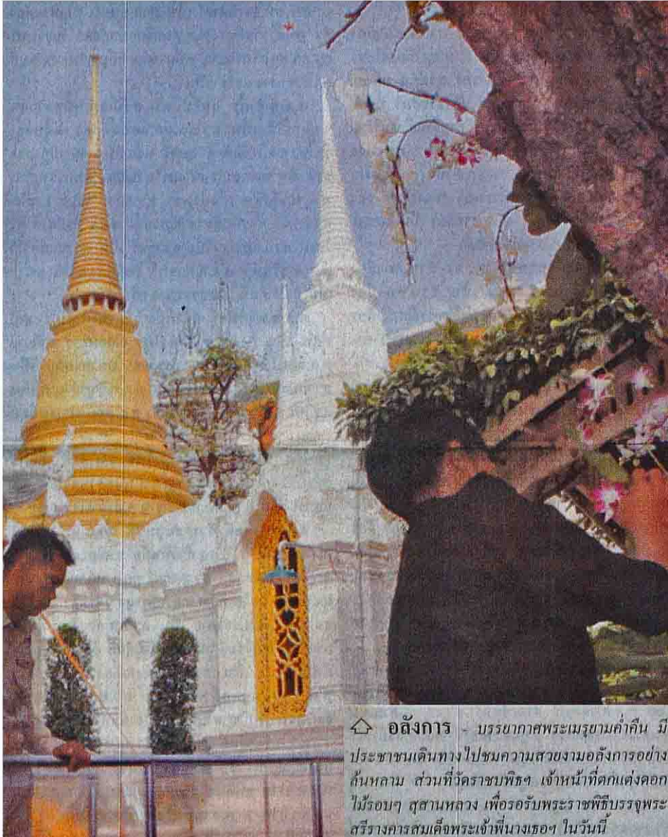
🏠 อสังการ - บรรยากาศพระเมรุมาศเก่าคืน มีประชาชนเดินทางไปชมความสวยงามอสังการอย่างกันหลวม ส่วนที่วัดราชบพิธฯ เจ้าหน้าที่ตกแต่งดอกไม้ธูปเทียน สุสานหลวง เพื่อรอรับพระราชพิธีบรรจุพระศรีราชมงคลสมเด็จพระเจ้าพี่นางเธอฯ ในวันที่

ประจำพระชนมวาร ปางถวายเนตร ของสมเด็จพระเจ้าพี่นางเธอ เจ้าฟ้ากัลยาณิวัฒนาฯ ทรงทอดพระเนตรแบบและพระราชทานพระวินิจฉัยด้วยพระองค์เอง ทรงเททองหล่อเมื่อครั้งทรงเจริญพระชนมายุ 80 พรรษา พระพุทธรูปประจำพระชนมวารที่จำลองนี้ หล่อด้วยโลหะผสมมีทองคำชนวนจากทองคำส่วนพระองค์ของสมเด็จพระเจ้าพี่นางเธอ เจ้าฟ้ากัลยาณิวัฒนาฯ ที่ท่านผู้หญิงที่ศานด้วย ครุสงคราม มอบให้นำมาเป็นทองชนวน องค์พระพุทธรูปสูง 18 นิ้ว ฐานกว้าง 9 นิ้ว ปัดด้วยทองคำเปลว 100 เปอร์เซ็นต์ เททองหล่อ เมื่อวันที่ 13 พ.ย.2551 เวลา 14.14 น. ณ ลานหน้าพระอุโบสถวัดราชบพิธฯ และจะประดิษฐานประจำแท่น ในวันอังคารที่ 18 พ.ย.นี้