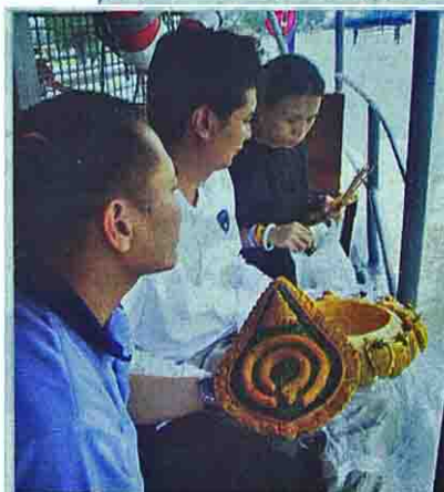
เชิญยอดพระจิตกาธานไปจำเริญ (ลอยน้ำ)