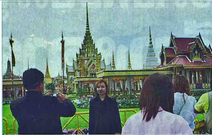
ประชาชนและนักท่องเที่ยวบันทึกภาพพระวิจิตรเสถียร ณ มณฑลพิธีท้องสนามหลวง