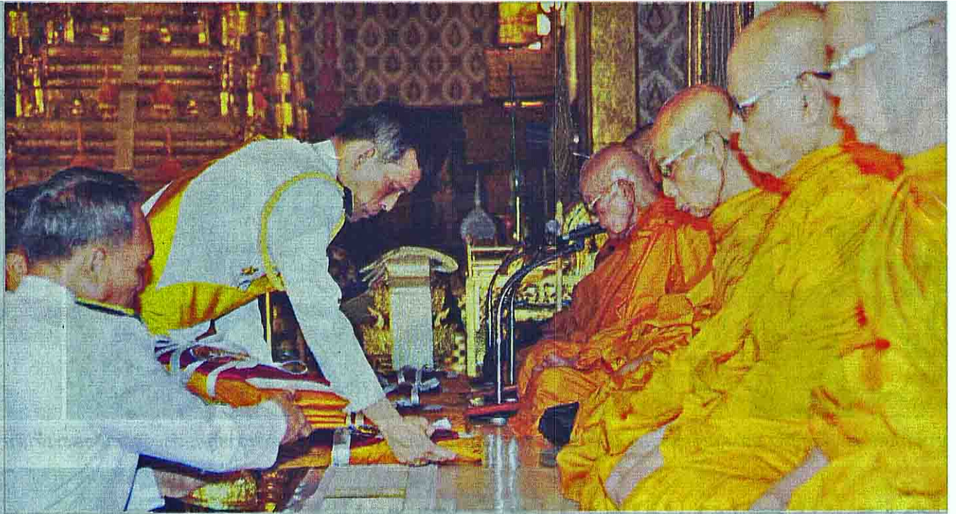
สมเด็จพระบรมโอรสาธิราชฯ สยามมกุฎราชกุมาร เสด็จ ฯ ทรงทอดผ้าไตรถวายพระสังฆมณฑลที่วัดพระเชตุพนวิมลมังคลารามราชวรมหาวิหาร