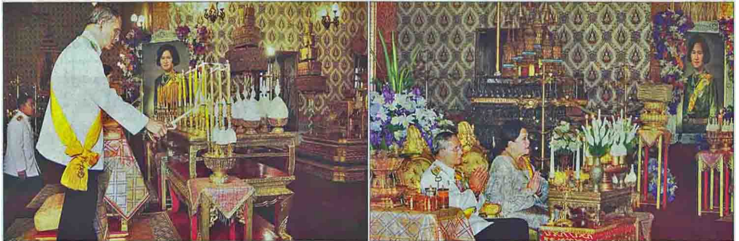
พระบาทสมเด็จพระเจ้าอยู่หัว และสมเด็จพระนางเจ้าฯ พระบรมราชินีนาถ เสด็จฯ ไปทรงบำเพ็ญพระราชกุศลพระอัฐิสมเด็จพระเจ้านางเธอ เจ้าฟ้ากัลยาณิวัฒนา กรมหลวงนราธิวาสราชนครินทร์ ณ พระที่นั่งดุสิตมหาปราสาท ในพระบรมมหาราชวัง