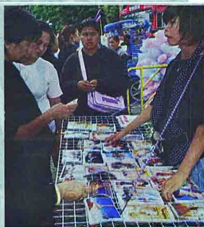
ประชาชนซื้อพระฉายาลักษณ์เป็นที่ระลึก