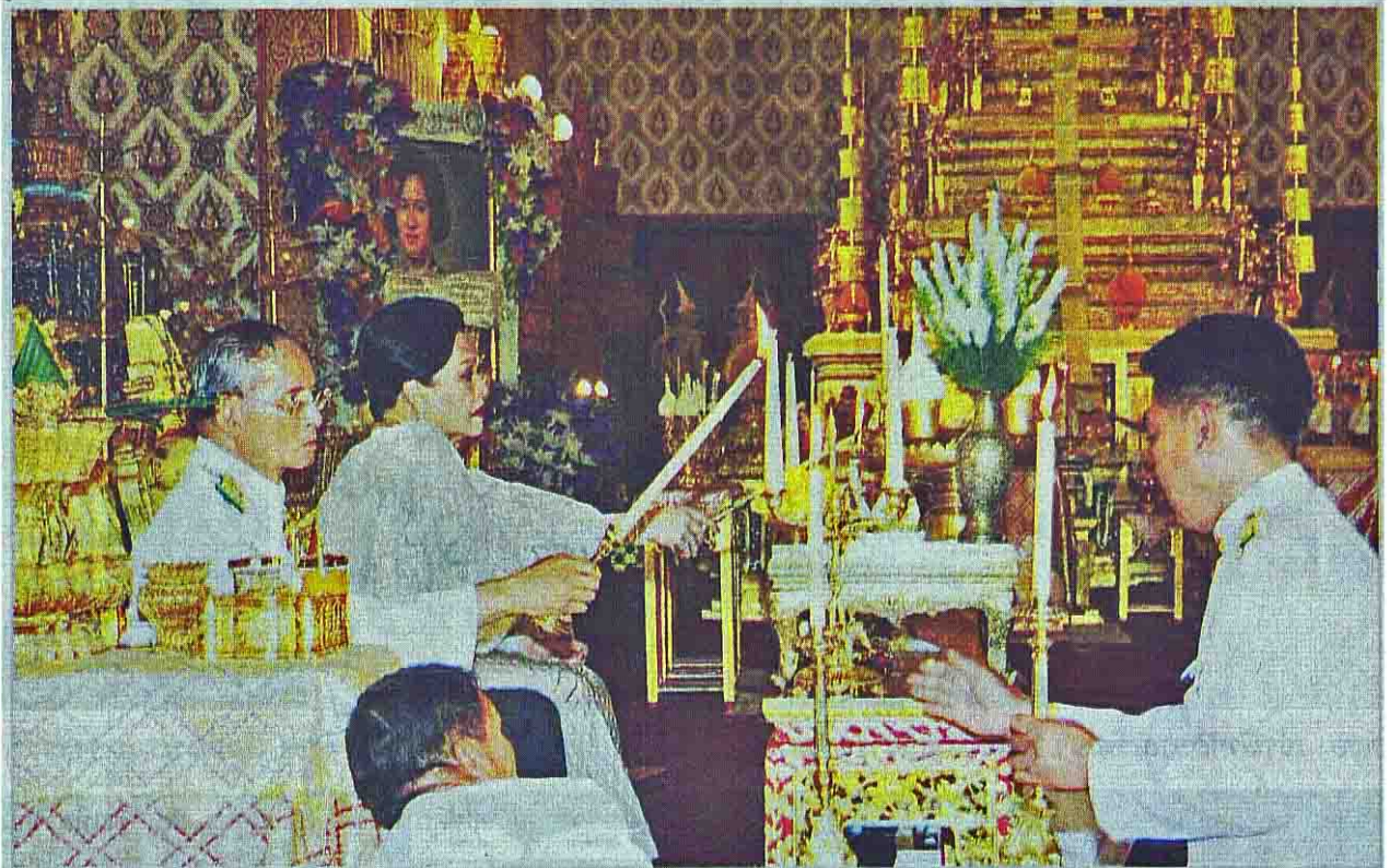
พระบาทสมเด็จพระเจ้าอยู่หัว และสมเด็จพระนางเจ้าฯ พระบรมราชินีนาถ เสด็จฯ ทรงบำเพ็ญพระราชกุศลพระอัฐิ